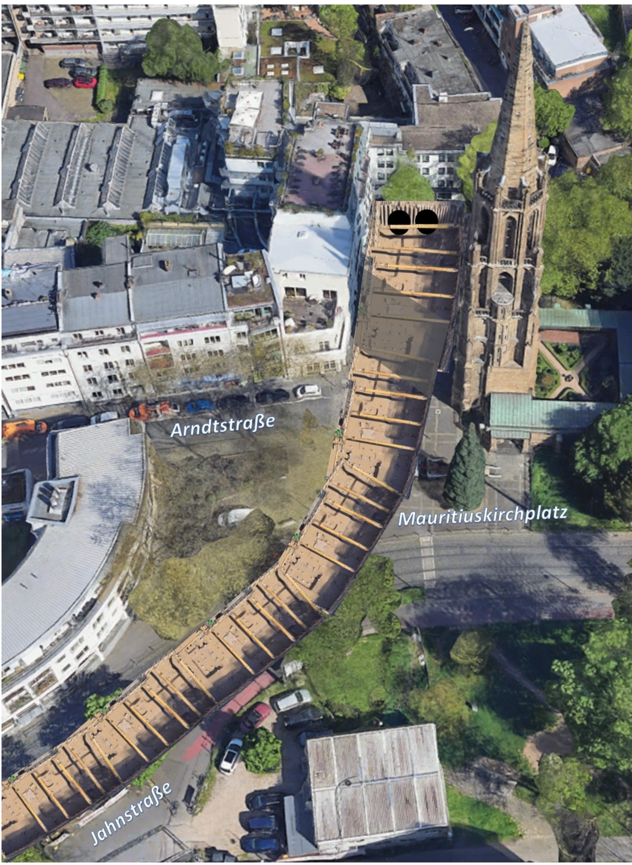
Bauloch U-Bahn Mauritiuskirchplatz

Bündnis Verkehrswende Köln R. Beierling-Hémonet 2024