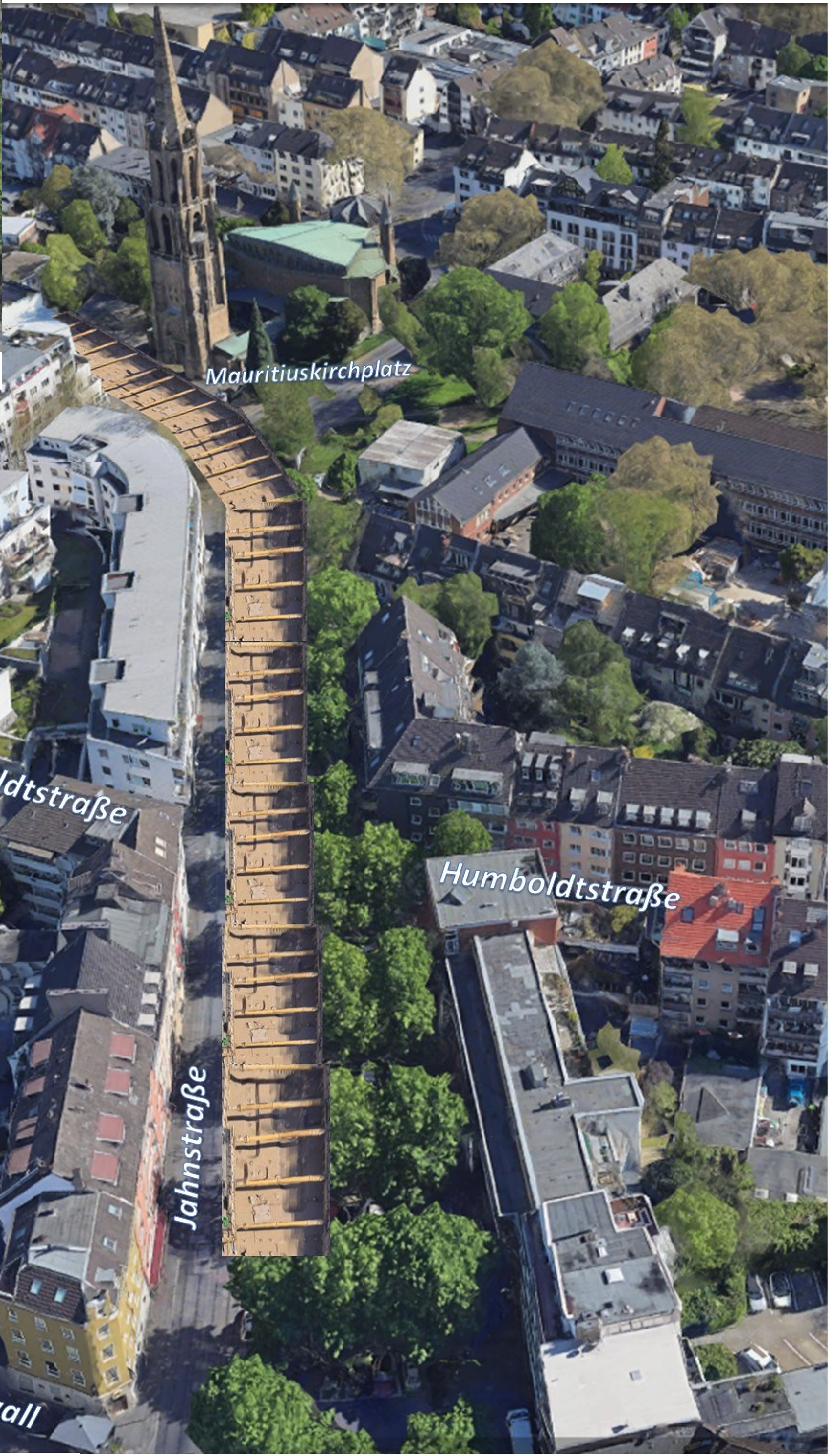
Bauloch Tunnel rampe Jahnstraße

Bündnis Verkehrswende Köln R. Beierling-Hémonet 2024